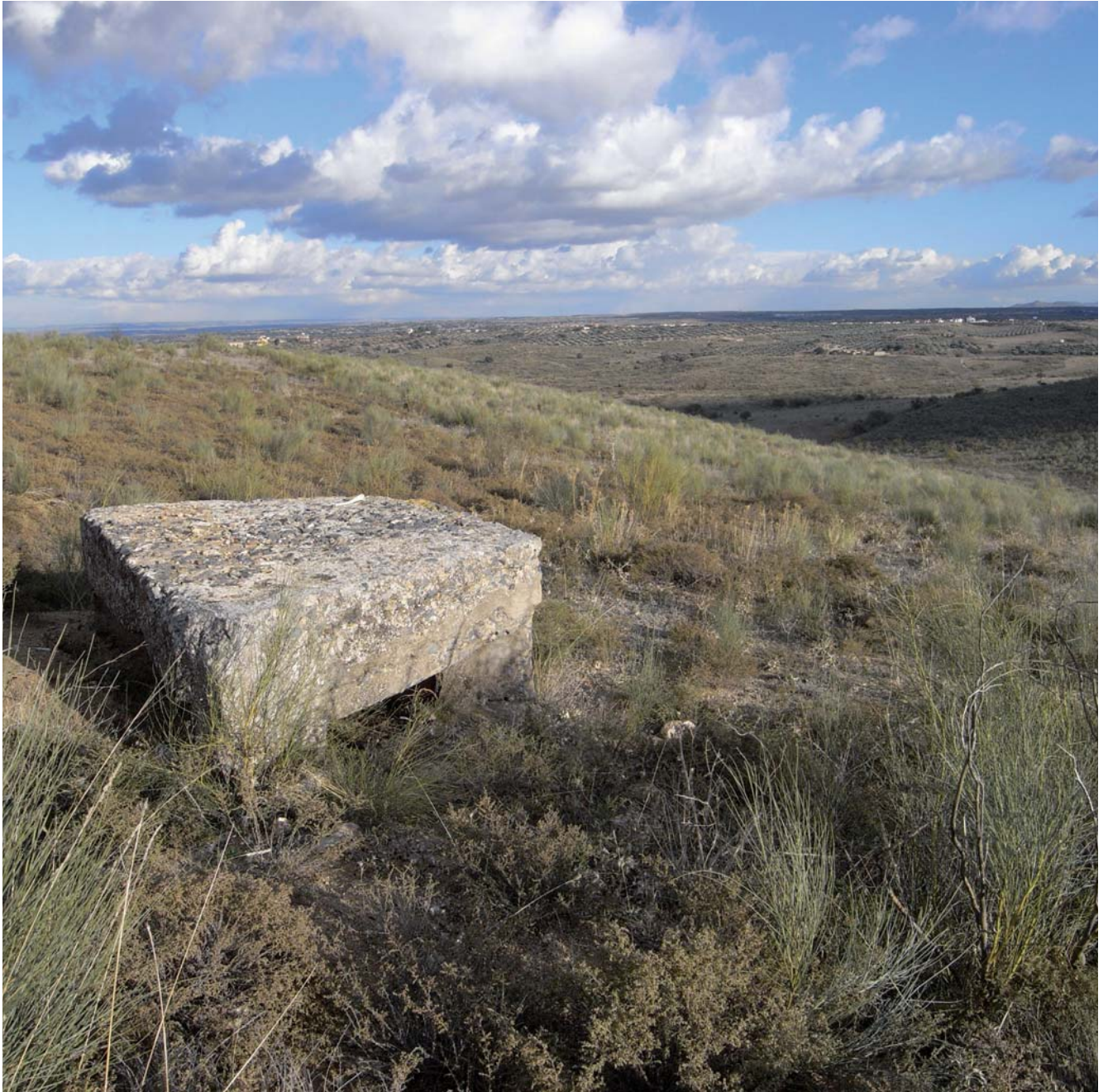
Nido de ametralladoras del Cerro de los Palos.