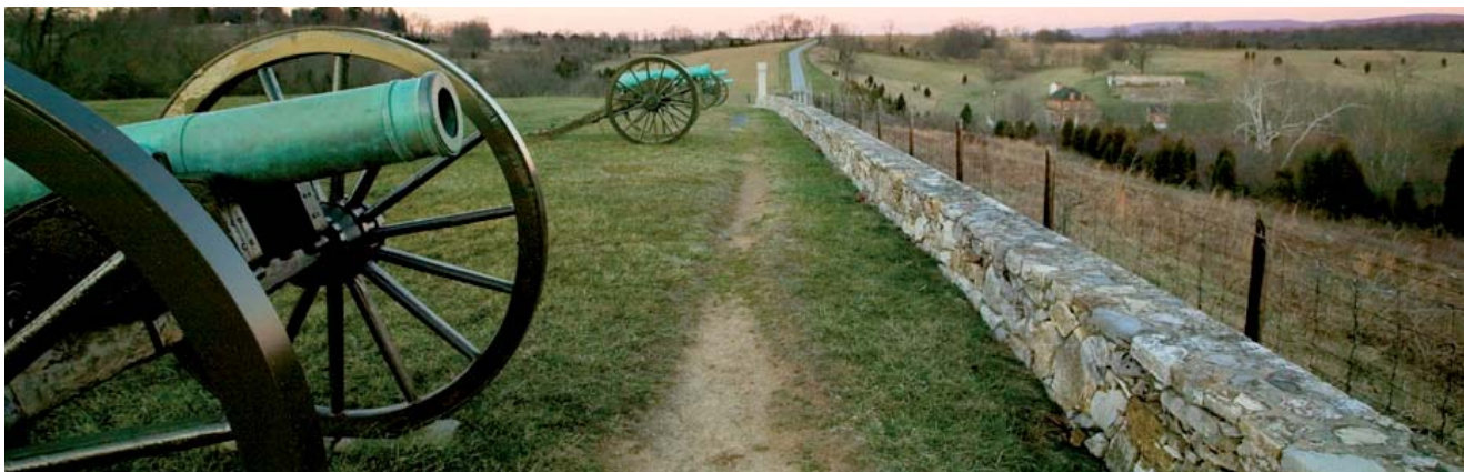
Campo de batalla de Antietam, Maryland (EE.UU.).

No cabe duda de que el conflicto bélico que más interés ha generado es el de la Guerra Civil española. Son escasas las declaraciones de BIC de los escenarios y además casi siempre de forma parcial, ya que solo se musealiza la visita la parte “visible” de las fortificaciones. El objetivo de la mesa es debatir sobre las posibilidades de acondicionamiento de estos paisajes arqueológicos, con el fin de garantizar su conservación y realizar la divulgación adecuada de este importante periodo de nuestra historia.