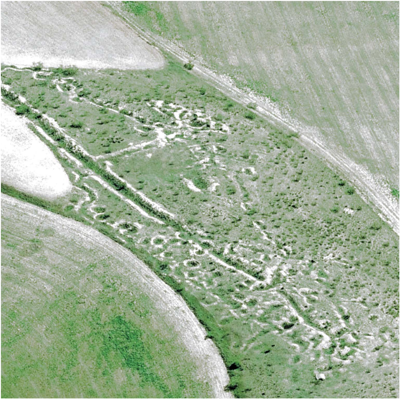
Trinchera 17 del Cerro de los Palos.