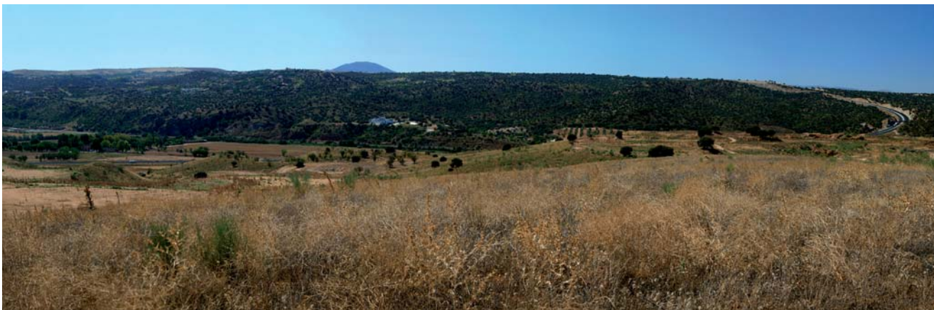
Cerro de los Palos en la actualidad.

La penúltima capa de esta “epidermis cultural” es el paisaje que se generó entre los años 1936 y 1939 con motivo de la Guerra Civil española. Una capa de una gran complejidad, ya que suma a su vez otros muchos paisajes y también una de las que más riesgo corre de desaparición. Un paisaje efímero en su génesis pero esperamos que no lo sea en su conservación para las generaciones venideras.