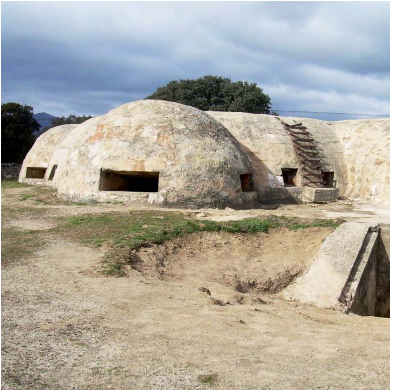
Blockhouse de Navalagamella.