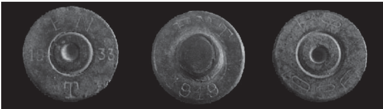
Vainas de cartucho localizadas en el transcurso de los trabajos arqueológicos.