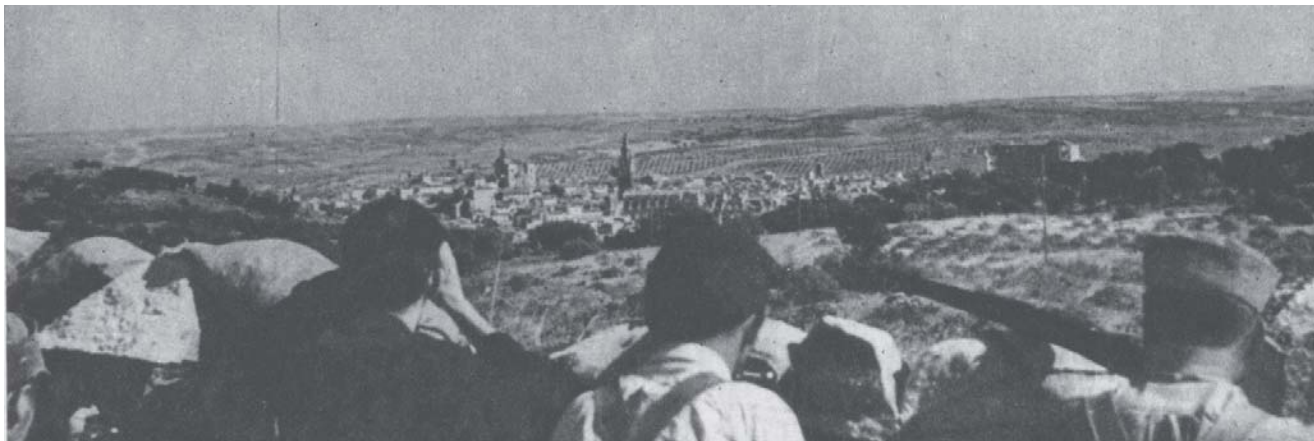
Militares republicanos en la Sisla.

Los restos de los primeros momentos han sido muy difíciles de detectar, así como los episodios bélicos que se vivieron en los años 1937 y 1938. Más “visibles” son los restos inmuebles generados por los dos bandos al final de la contienda.