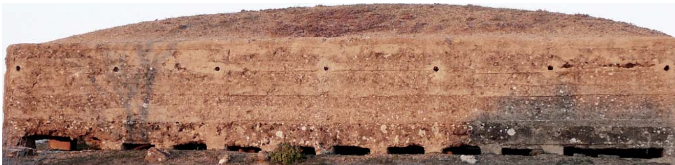
Fortificación de hormigón.

La más importante de todas fue la que tuvo como fin la ampliación de la cabeza de puente en los sectores del puente de Alcántara y el de San Martín, llevada a cabo por las tropas nacionales entre los días 7 y 13 de mayo de 1937. Esta operación, conocida como el “combate del cerro de los Palos” y en algunos medios como “batalla de los cigarrales”, fue diseñada por el entonces coronel Yagüe. Tras cerca de una semana de enfrentamientos constantes en los que se llegaron a producir combates cuerpo a cuerpo y actos de indudable valor en ambos ejércitos, algunos de los cuales fueron reconocidos con la concesión de las condecoraciones más destacadas, finalizó la fase más activa que conoció el Frente y se inició una nueva etapa caracterizada por la fortificación de las posiciones recién adquiridas y la construcción, ahora sí y por ambas partes, de un auténtico frente de guerra que ayudó a estabilizar la situación. Su importancia ha quedado documentada en la entidad de las construcciones realizadas y en el inicio de la ordenación bélica del espacio más cercano al sur de Toledo.