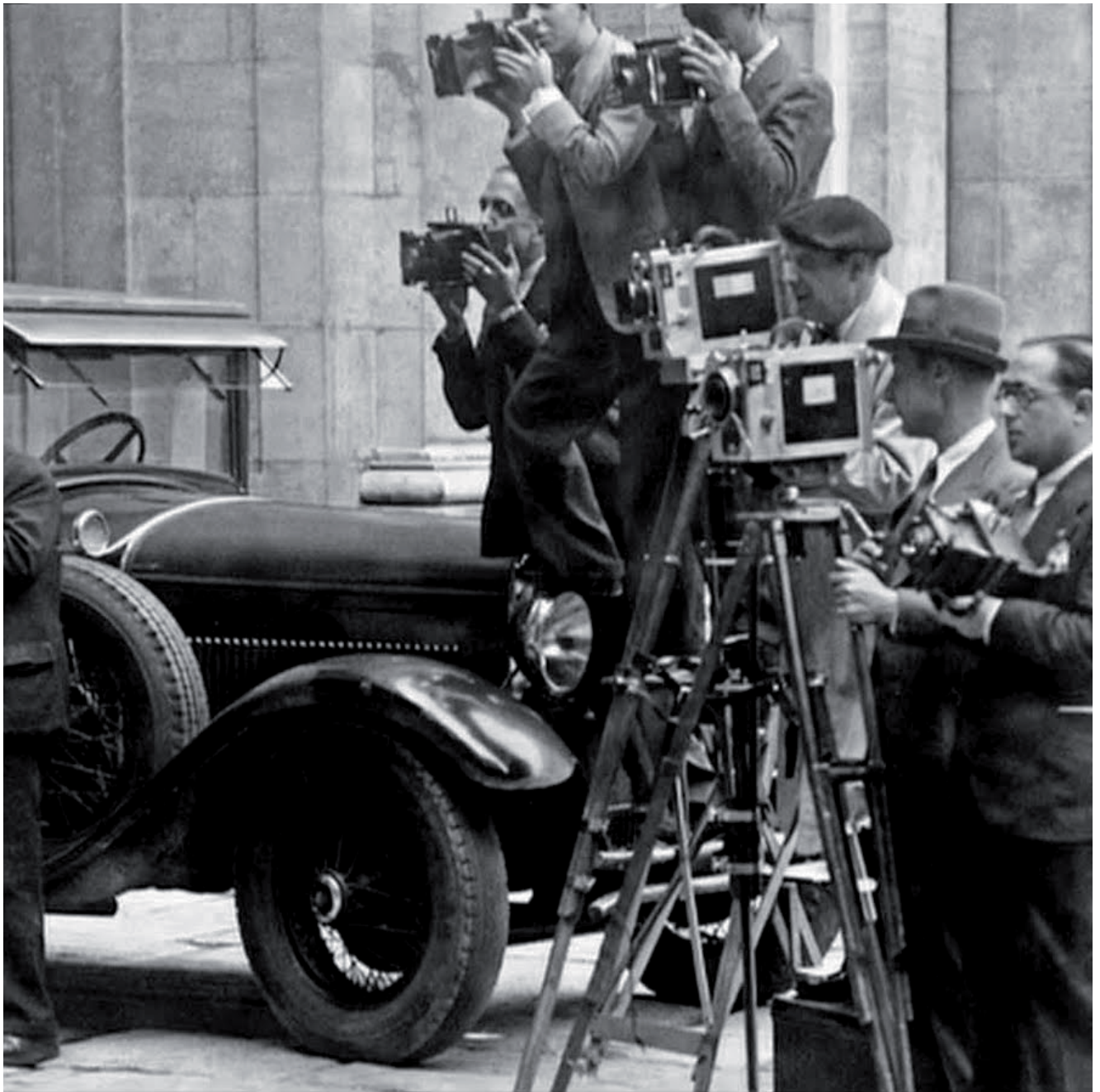
El trabajo de los fotógrafos y los corresponsales de prensa fue fundamental para el conocimiento del conflicto. La Guerra Civil española provocó la presencia de la prensa internacional, tanto de fotógrafos como de periodistas.