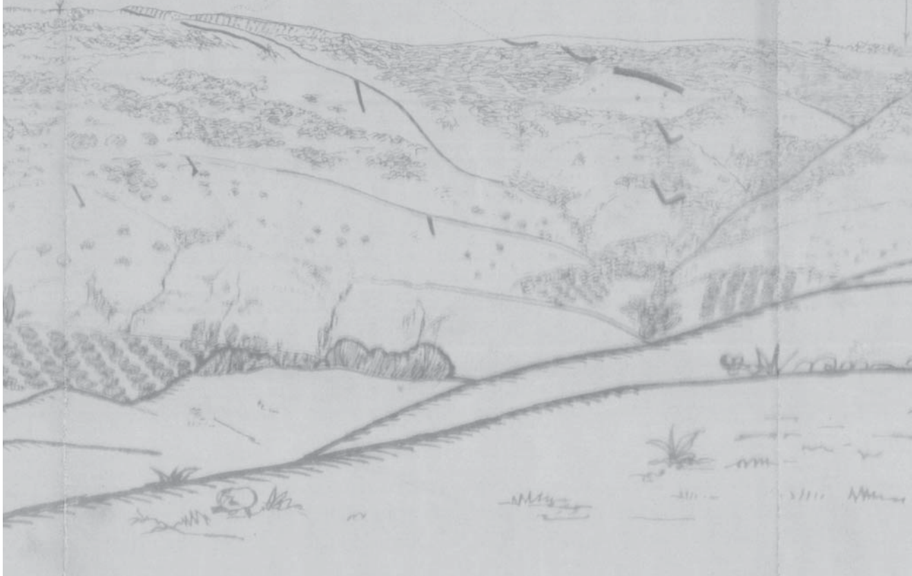
Posiciones nacionales en el Cerro de los Palos, al fondo trincheras republicanas.